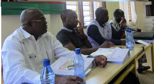
Vue partielle des participants au séminaire

(BT) sur poteau ou en cabine alimentant le réseau BT qui dessert les abonnés. Le produit ainsi acheminé chez le client doit être de bonne qualité et d'un coût abordable. Sa facturation se fait au moyen d'un système de comptage (compteur électromécanique ou compteur électronique à prépaiement) suivant une politique de tarification