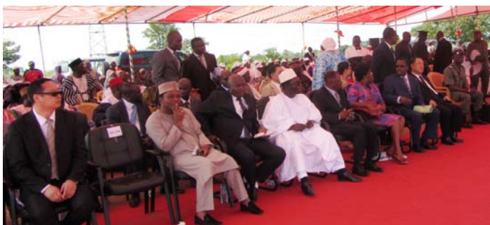
Vue partielle des participants

Enfin , il a exprimé toute sa reconnaissance aux partenaires d'Eximbank-Chine qui a financé entièrement ce projet sans oublier les Instances de la CEB, qui par leur sens de responsabilité et de négociation ont permis de franchir ce pas.