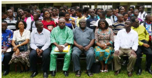
Photo de famille des colons 2013

Après avoir rappelé l'enrichissement culturel et intellectuel que la colonie de vacances apporte aux enfants, le représentant de la CEB a souhaité un bon retour aux colons dans leurs foyers respectifs.