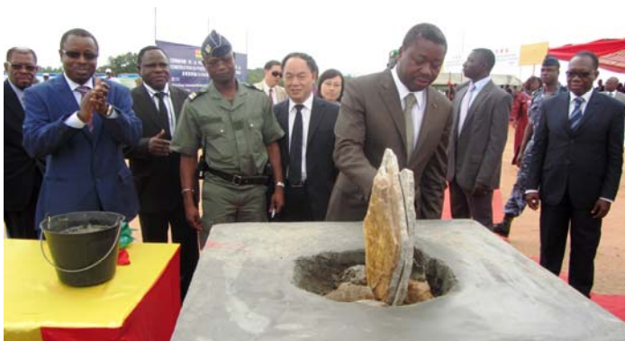
Son Excellence M. Faure GNASSINGBE posant la 1 ère pierre

Le Ministre des Mines et de l'Energie par intérim M. Dammipi NOUPOKOU, s'est réjoui quant à lui de la construction de cette infrastructure qui permettra aux populations septentrionales d'avoir accès aux sources énergétiques de qualité et sécurisantes.