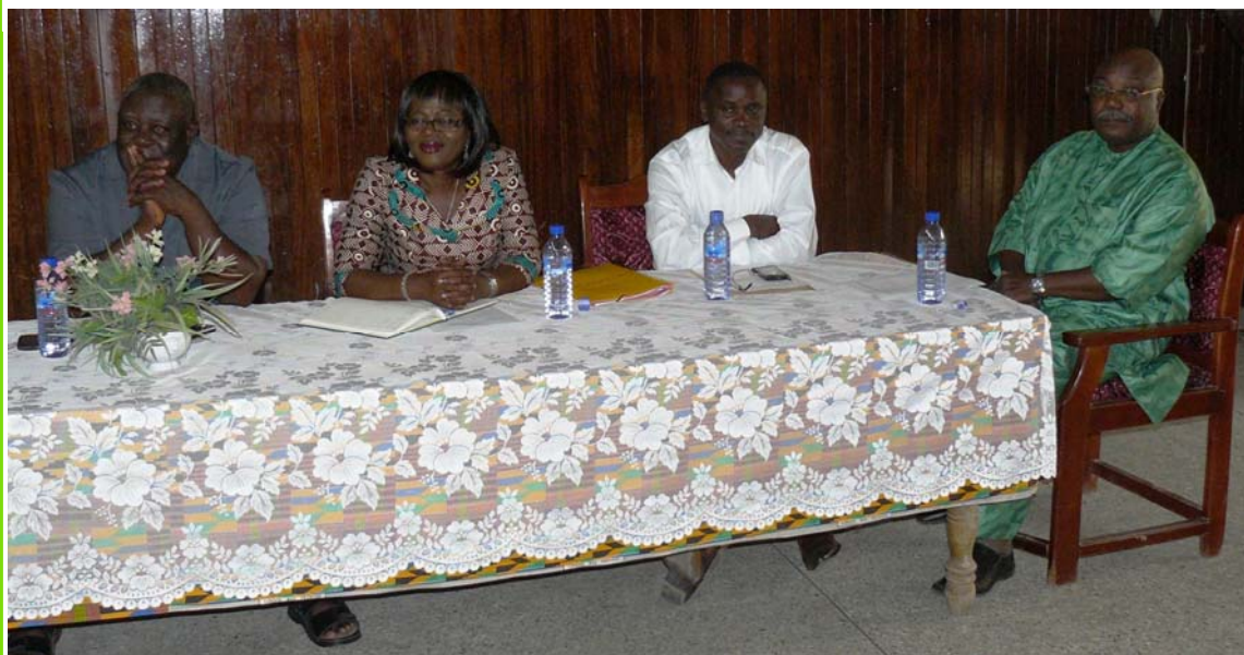
Le présidium à la cérémonie d'ouverture au Ghana

C'est dans une ambiance festive que la cérémonie de clôture de la colonie de vacances 2013, 19 ème édition s'est déroulée le vendredi 30 août 2013 au Centre de Formation et de Perfectionnement d'Abomey-Calavi au Bénin.