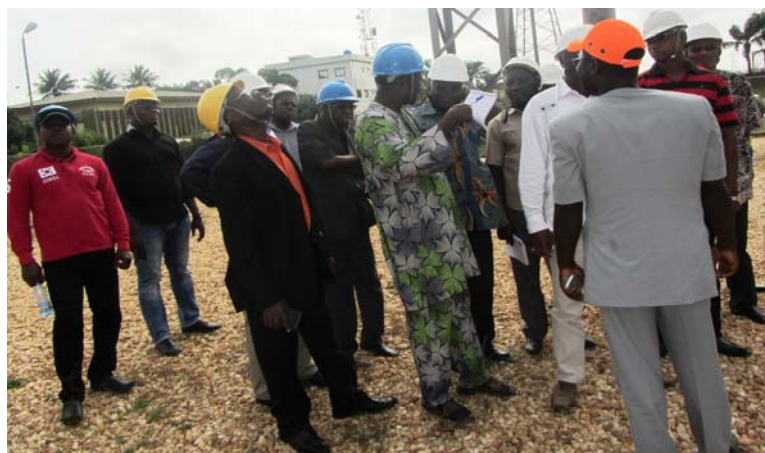
Monsieur le Directeur écoutant les préoccupations d'un séminariste

L'objectif de cet atelier de formation est de donner aux cadres non électriciens des connaissances de base en matière d'électricité.