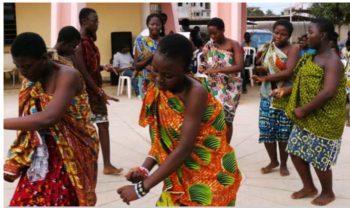
Les colons filles démontrent leur talent de danse traditionnelle