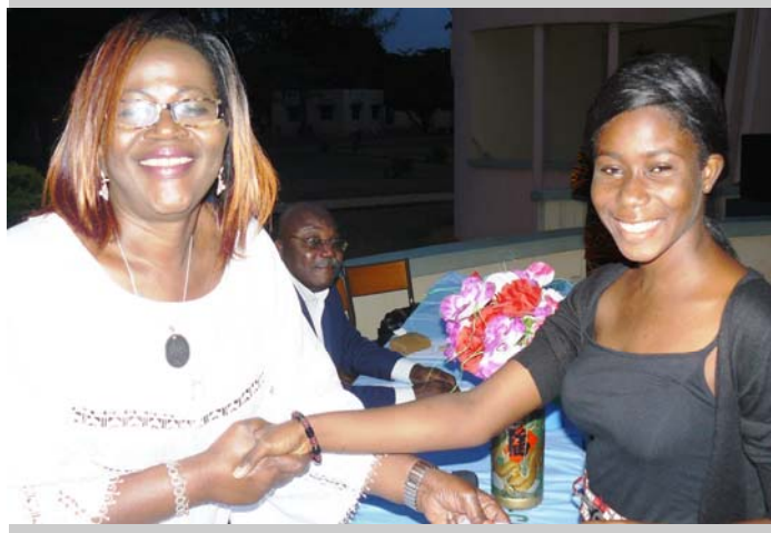
Un colon recevant un cadeau des mains du représentant de la CEB