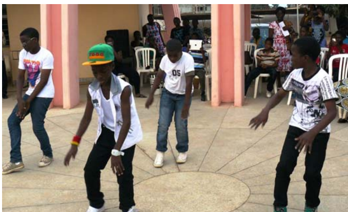
Les enfants colons dans une démonstration de danse

Putile à l'agréable, elles ont été marquées par des cours d'anglais pour les colons de la CEB et des cours de français pour ceux de la VRA, des projections de film, du sport, des jeux divers, des travaux manuels et des soirées récréatives.