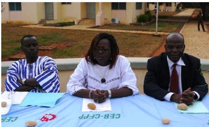
Le Présidium à la cérémonie de clôture au CFPP au Bénin

3 ème étape (Bénin): Du 25 au 30 août 2013 visite de la plage, du centre animalier de BIMYNS à Wekèvia (Porto Novo) et le marché de Dantokpa à Cotonou. Une soirée récréative a mis fin à cette troisième étape le 30 août 2013. Ces visites culturelles ont été enrichissantes et éducatives et pour joindre