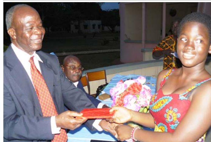
Le représentant du DG CEB remettant un cadeau à un colon