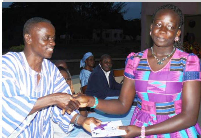
Le représentant de la VRA remettant un cadeau à un colon